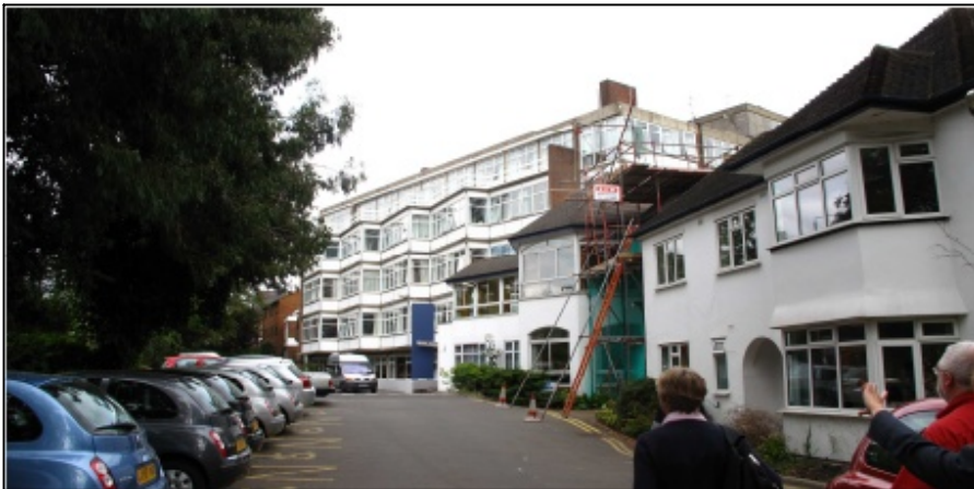
Das St. Christopher's Hospiz nach seiner Renovierung