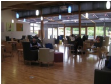
Halle des Hospizes

Heute hat das Hospiz 48 Betten, 250 festangestellte Mitarbeiter und 600 Ehrenamtliche. Damit ist es ein sehr großes Haus.