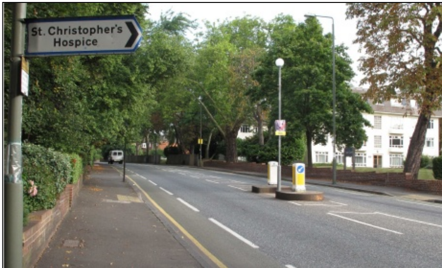
Das St. Christopher's Hospiz als Wegweiser

Jedes Jahr besuchen 3.000 Menschen das Bildungszentrum des Hospizes. Selten hat man so engagierte Mitarbeiter gesehen. Es ist eine Ehre für jeden Einzelnen am St. Christopher's Hospiz arbeiten zu dürfen. Das Hospiz ist weiterhin eine Lokomotive für Ideen in der Palliativmedizin. Die Revolution, die Cicely Saunders- selbst ein Beispiel für Multiprofessionalität durch ihre 3 Berufe als Krankenschwester, Sozialarbeiterin und Ärztin begann, setzt sich auch nach ihrem Tod in ihrem Hospiz 20005 fort. Sie ist und bleibt ein Monument durch ihre beispielhafte Arbeit.